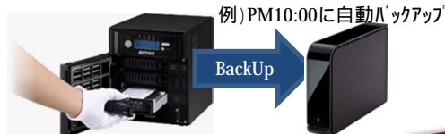
例) PM10:00に自動バックアップ

BUFFALO RAID NAS2TB ¥59,800-、USB HDD2TB ¥12,800