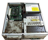
埃とヤニ塗れのPC内部

過電流や落雷、システムエラーで起動しなくなったパソコンで泣いたご経験は無いでしょうか？データ復旧費も凄く高く、そのまま廃棄した話を良く聴きます。ディスクに障害の場合100%と言えませんが、取りあえずご相談下さい。格安料金にて、移行を可能か確認致します。残念ながらHDD破損等の場合、外注となり別途見積となります。